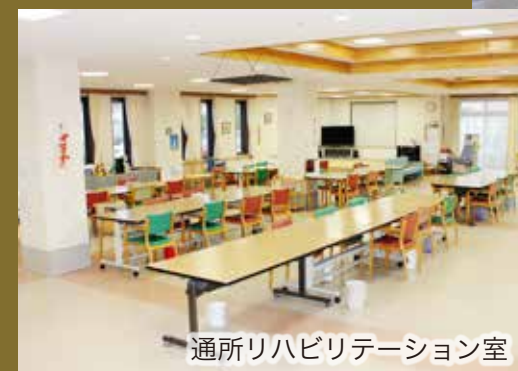
通所リハビリテーション室

ご利用者さまの心身機能の維持向上や日常生活の自立のために必要なリハビリテーション、食事・入浴・レクリエーションなどのサービスを日帰りでご利用いただけます。可能な限り自宅において自立された生活を送るため、居宅介護サービス計画に基づき、必要なリハビリテーションを行い、心身機能の維持回復を目指します。施設からご自宅までの送迎車をご用意しておりますので、安心してリハビリを続けることができます。