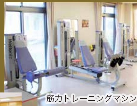
筋力トレーニングマシン